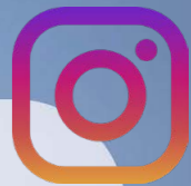
LILY - @LILYENNORUEGA

"Είναι μια έντονη εμπειρία, γεμάτη εντυπωσιακά τοπία, με ένα πολύ αποδεκτό φόρτο εργασίας... Και είναι μόνο η αρχή αυτής της περιπέτειας."